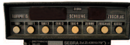
Taxameter Sebra Baujahr 1979