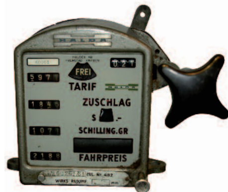
Taxameter Halda Baujahr 1961

Geeicht werden müssen Taxameter immer auch nach Reparaturen und nach Einspielung neuer Taxitarife. Um die Verwendung nach Reparaturen