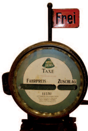
Seit über 100 Jahren gibt es Taxameter für Taxis. Dieses mechanische Modell ist Baujahr 1907

Fahrpreisanzeiger (Taxameter) sind eichpflichtige Messgeräte wie etwa auch Waagen, Gas-, Wasser-, Wärme- und Elektrizitätszähler, Zapfsäulen an