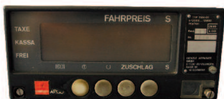
Taxameter Kienzle Baujahr 1985

oder Tarifeinspielungen bis zur Eichung zu ermöglichen, wird der Taxameter nach erfolgter Justierung mit einem Sicherungszeichen versehen, um Eingriffe in das Messgerät bis zur Eichung zu verhindern. Dadurch können messtechnische Eigenschaften nicht mehr beeinflusst werden.