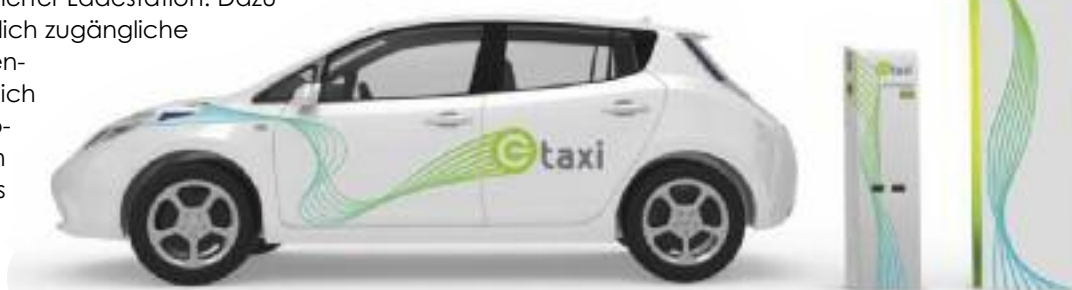
Grafik: Holding Graz Linien

Multimodale Knoten beinhalten immer eine Öffi-Haltestelle, ergänzt durch 30 bis 50 Fahrradabstellplätze, einen E-Taxi-standplatz für zwei Fahrzeuge und Standplätze für Carsharing E-Fahrzeuge mit reservierter Ladestation. Dazu sollen noch eine zweite öffentlich zugängliche Ladestation und ein Leihwagen-abholplatz vor Ort sein. Zusätzlich sind die Knoten mit einem Info-Terminal ausgestattet, an dem Kunden die Abfahrtszeiten des Öffentlichen Verkehrs ablesen und Carsharing-Fahrzeuge buchen können. Außerdem