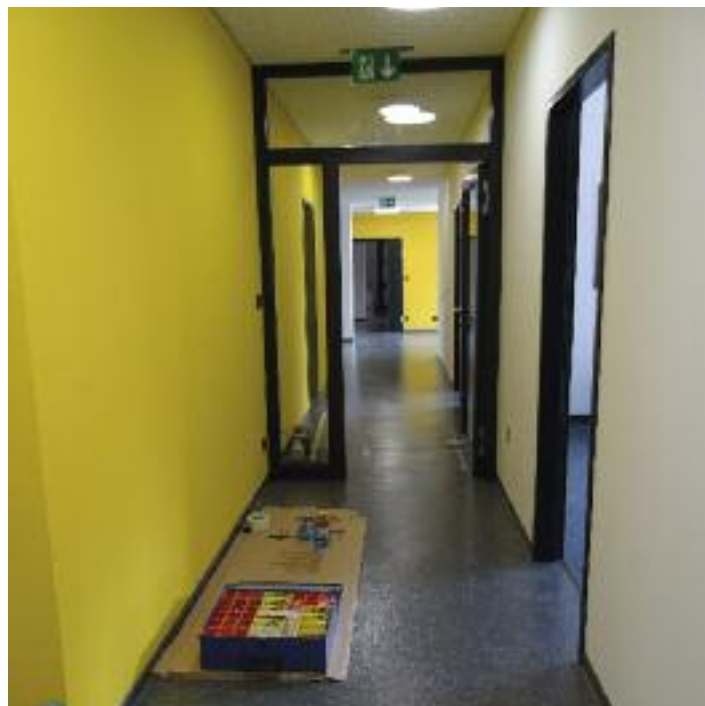
Hier sieht man bereits die neue Deckenschalldämmung sowie die neue Farbgestaltung der Wände, Böden und Türen.