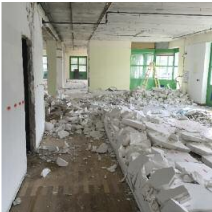
Sämtliche Innenwände, Decken und Böden wurden entfernt, um ein Schulungcenter nach modernstem Standard zu errichten.

gen. Jeder Arbeitsplatz für die Kursteilnehmer wird mit modernstem Equipment wie PC, usw. ausgestattet. Schulungsleiter Leopold Kautzner und sein Team freuen sich bereits auf das neue Zuhause, das noch heuer mit einem Einweihungsfest eröffnet werden soll.