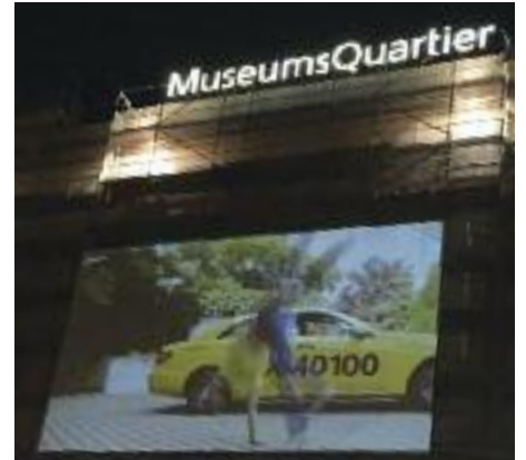
Die waghalsige Performance mit dem 40 100-Taxi war während des Festivals auf einer Videowall am MuseumsQuartier zu sehen.

Seine aufsehenerregenden Stunts vor, auf und neben dem Taxi (gedreht wurde am Firmengelände von Taxi 40 100 in der Pfarrgasse) sind in einem Video festgehalten, das auf der riesigen Videowall am MuseumsQuartier während des Tanzfestivals öffentlich zu sehen war.