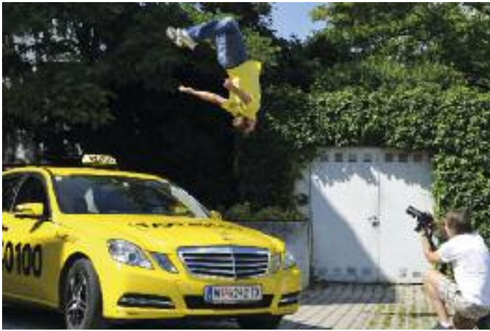
„Der mit dem Taxi tanzt“: Parkour-Künstler Sascha Hauser in Aktion beim Video-Dreh bei Taxi 40 100.

ImPulsTanz steht für Performances, Workshops, Research-Projekte und Social-Programm. 53 KünstlerInnen und Compagnien bespielten von 14. Juli bis 14. August in 65 Produktionen, davon 14 Uraufführungen, nicht nur die großen Bühnen der Stadt, sondern auch Museen und Galerien und weitere 40 Studios über ganz Wien verteilt.