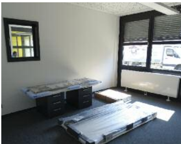
Die einzelnen Räume in der Taxischule sind bereits neugestaltet. Auch die ersten Büromöbel sind mittlerweile angeliefert worden und werden in den nächsten Tagen aufgebaut.